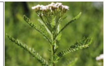
A. Hundseher - Kenntnis der Materia Medica