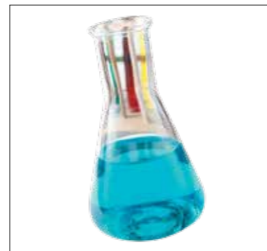
Carboneum sulphuratum – Roger Morrison