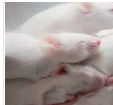
Homöoprophylaxe – Gisela Immich