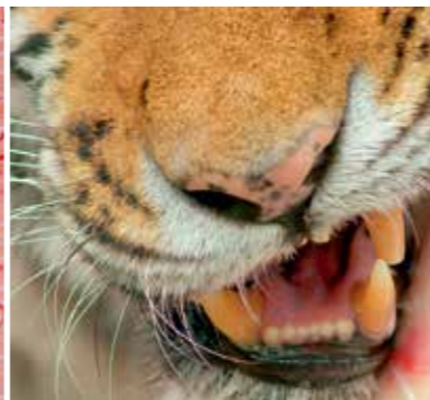
Migräne – Irmela Göckenjan-Storz